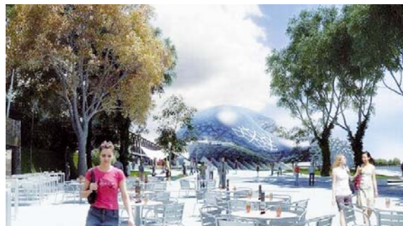
Pôvodný projekt návrhu vizualizácie pamätníka a múzea na Gondovej ulici.