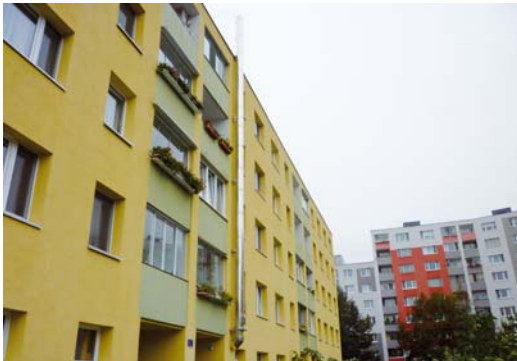
Bytový dom na Haanovej ulici. Lacnejšie a kvalitnejšie s vlastnou kotolňou.