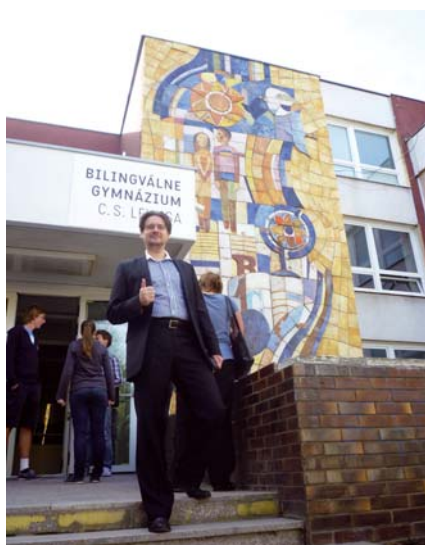
Otvorenie nového školského roka som si nemohol nechať ujsť.

Po 6 rokoch sa z opusteného priestoru na Haanovej 28 stalo Bilingválne Gymnázium C. S. Lewisa. K jeho ďalšiemu rozvoju a rozvoju okolitého priestoru môžete prispieť aj vy.