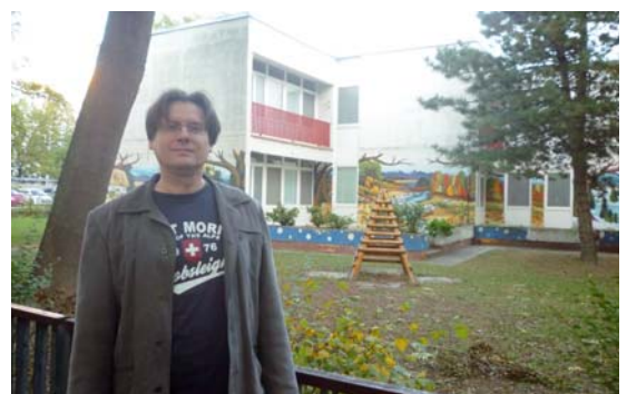
Byť v škôlke si zaslúžia všetky deti, aj vďaka príspevku.

Bez zmeny zákona k žiadnemu hromadnému odpájaniu sa nedôjde. V niektorých prípadoch však uznesenie prijaté mestskými poslancami môže odpojenie sa a výstavbu nového tepelného zdroja uľahčiť. Vedenie Petržalky by sa však malo konečne spamätať a investovať financie do tepelnej infraštruktúry, inak sa nič nezmení a ľudia budú mať aj naďalej záujem odpájať sa. Potom obyvatelia Petržalky možno uveria, že ich starosta „nekope“ za teplárenskú lobby, ale za to, aby sa im žilo lepšie a nemuseli si stavať vlastné domové kotolne.