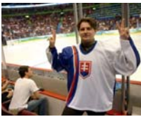
Šport dokáže spájať ľudí.

Ako poslanec sa budem zasadzovať za to, aby dotačné pravidlá mesta i obce boli adresnejšie, dostatočne prísne z hľadiska ich možného obchádzania, pridelované transparentne a hodnotené z hľadiska ich využitia. Vždy rád podporím systém participatívneho rozpočtu a rovnako aj systém určenia viacročných priorít umožňujúcich viacročné financovanie dotačných projektov.