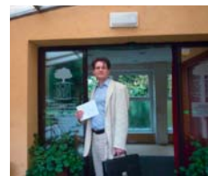
Odvovzdanie dakovných listov seniorom, ktorí ma chcú za poslanca.

V súčasnosti je každý 10-ty Petržalčan osobou vo veku nad 65 rokov a tento počet bude narastať. Obec ani mesto v tomto smere nemôžu zostať pasívni a musia podporovať seniorov rôznymi spôsobmi, osobitne aj tým, že vytvoria možnosti, aby mali (finančne) zvýhodnený prístup ku kultúrnym, športovým (fitness) a zdravotníckym zariadeniam, a to formou zliav zo vstupného alebo príspevku na dopravu. Je potrebné podporovať zariadenia, akými sú napr. Dom tretieho veku v Petržalke a denné stacionáre pre seniorov. Budovanie, rekonštrukcia a modernizácia takýchto zariadení sociálnych služieb je možná aj z finančných prostriedkov EÚ na roky 2014 až 2020, rovnako ako aj podpora zariadení sociálnej kurately (detské domovy) a podpora výkonu odborných činností v tejto oblasti (napr. psychológia a sociálna práca). Našu podporu a pomoc si okrem seniorov a sociálne odkázaných ľudí vyžadujú aj ľudia zo zdravotným postihnutím (napr. budovaním bezbariérových prístupov a podporou aktivít, ktoré im zlepšia kvalitu života).