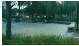
Takto to vyzerá, keď cyklo doprava funguje.

stavbou. Dôležité je tiež naplnenie konceptu TWIN CITY medzi Bratislavou a Viedňou. Systém parkovania by mal byť prijatý jednotne na úrovni mesta a mal by dať jasnú preferenciu ľuďom, ktorí sú Bratislavčania, ak žijú na území Bratislavy, ako aj životnému prostrediu.