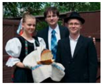
Podpora umenia napomáha upevňovaniu kultúrnej identity.

Sú to predovšetkým rôzne umelecké súbory, najmä folklórne súbory, miestne organizácie Slovenského rybárskeho zväzu, organizácie venujúce sa bezdomovcom, športové kluby a organizácie venujúce sa charitatívnym projektom alebo projektom udržania historického a kultúrneho dedičstva (napr. systém vojenských bunkrov v Petržalke), ktoré si zaslúžia podporu. V neposlednom rade je to cirkev a mnohé reholné spoločnosti, ktoré sú jej súčasťou a ktoré svojimi aktivitami neraz nahrádzajú štát, mesto, či obec. Každoročne sa len v Petržalke rozdelí v podobe dotácií viac ako 100 000 eur z rozpočtu obce na podporu takýchto projektov a oveľa vyššia suma na úrovni mesta, žiaľ chýba väčšia adresnosť, hodnotenie efektívnosti využitia pridelených dotácií a väčšia informovanosť obyvateľov Bratislavy.