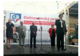
Viem, ako organizovať farmárske trhy.

Ako poslanec budem podporovať obyvateľov Petržalky a Bratislavy v prípade, ak si vo svojom okolí neželajú herne a hazardné miesta. Budem podporovať fungovanie zdravého podnikateľského prostredia, ktoré prináša zisk tak firmám, ako aj dane mestu, či obci vrátane kultúrno-kreatívneho priemyslu a vzdelávania k podpore kvalitnej lokálnej značky (farmárske trhy).