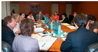
Udeľovanie dotácií si vyžaduje aj neustraných odborníkov v dotačnej komisii.

Ako poslanec dohliadnem na to, aby sa v zmysle nového zákona prijali do 30. 6. 2015 pravidlá, ktoré umožnia nahlasovať prípady korupcie a podvodov s finančnými prostriedkami, a to aj anonymne, ako aj chrániť a odmeňovať oznamovateľov takýchto prípadov. Ak to bude nevyhnutné, navrhmem takéto pravidlá sám. Budem presadzovať otvorené výberové konania a odborníkov na miesta na obecnom a mestskom úrade a neodsúhlasím odmenu starostovi alebo primátorovi, pokiaľ nebude obec a/alebo mesto hospodáriť aspoň s vyrovnaným rozpočtom. Ako poslanec tiež dohliadnem na to, aby sa dotácie zo strany mesta i obce udeľovali transparentným spôsobom, odborne a aby nedochádzalo k ich zneužívaniu.