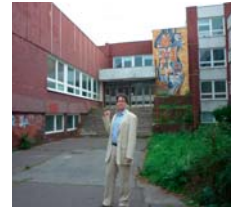
Čo bráni dohode s BSK na využití tejto opustenej školy?

so zdravotným postihnutím a k životnému prostrediu, budovanie doplnkovej štruktúry pre cyklo-dopravu a cyklistické infraštruktúry s napojením na integrované dopravné systémy, budovanie záchytných parkovísk a prepojením na MHD a zvyšovanie bezpečnosti zraniteľných účastníkov cestnej premávky (napr. chodci). Veľké dopravné projekty, ako je napr. električka do Petržalky by nemali byť len čisto technickou