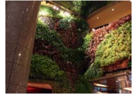
Environmentálnej investícii sa medze nekladú.

Petržalka, ale aj Bratislava by mala mať v zastupiteľstve takých poslancov, ktorí dokážu odolať tlaku a arogancii stavebníkov (developerov) a presadzovať záujmy mesta, obce a jej obyvateľov a nie záujmy finančných skupín. Akákoľvek výstavba by mala zohľadňovať priority v oblasti životného prostredia a mali by sa prednostne podporovať tzv. zelené projekty a infraštruktúra, ktoré napomáhajú rozvoju cestovného ruchu vrátane cezhraničnej spolupráce. Osobitná pozornosť by sa mala venovať aj adaptácii na zmeny klímy v Bratislave a energetickej efektívnosti budov a zariadení vo vlastníctve mesta a obce.