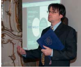
Veci je potrebné jasne a zrozumiteľne vysvetliť.

Ako poslanec podporím také pravidlá, ktorých účelom bude vytvorenie lepšieho miesta pre život v Bratislave a Petržalke v súlade s cieľmi uvedenými v jednotlivých bodoch môjho programu. Ak budú mesto alebo obec v tomto smere pasívni, dokážem takéto pravidlá vypracovať sám a predložiť ich na rokovanie mestského, či miestneho zastupiteľstva. Rád by som tieto pravidlá vždy vopred prekonzultoval aj s verejnosťou a chcem informovať ľudí aj o prijatých právnych predpisoch.