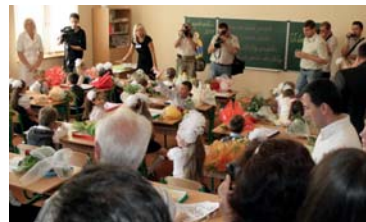
Slovenské deti na Ukrajine (Užhorod) sa takto tešia z novej školy. Prečo sa nemôžu takto tešiť aj deti v Bratislave-Petržalke z novej škôlky?

Čakať niekoľko rokov na zvýšenie kapacít v škôlkach je nedostatočný prísľub. Skutočným prísľubom, ktorý Vám môže reálne pomôcť, je zmena platných zákonov tak, aby ste dostali príspevok až do výšky 230 eur mesačne na 1 dieťa, ktoré Vám riaditeľ škôlky v mieste bydliska Vášho dieťaťa odmietol z kapacitných dôvodov prijať do materskej školy!