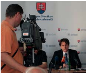
O opatreniach proti korupcii a podvodom treba informovať verejnosť.

Nestačí len prijať Etický kódex, ktorý sa neraz neuplatňuje, ale aj účinné pravidlá a nástroje, ktoré umožnia aj obyčajným ľuďom nahlásiť prípady korupcie a podvodov, a to aj anonymne, a následne byť za to aj odmenení mestom a obcou. Rovnako je potrebné mať na obecnom, či mestskom úrade odborníkov, ktoré dokážu prevziať na seba zodpovednosť a nakladať s finančnými prostriedkami hospodárne a efektívne. Keďže ide o verejné funkcie, všetky osoby vrátane členov dozorných rád obecných, či mestských podnikov, by mali byť do týchto funkcií obsadzovaní na základe otvoreného výberového konania. Primátorovi alebo starostovi by nemala patriť nenárodokatel'ná zložka platu (napr. odmena) až dovtedy, pokiaľ nebude rozpočet mesta alebo obce prebytkový.