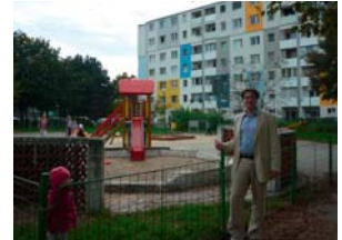
Takéto detské ihriská by mali byť v každom vntrobloku.