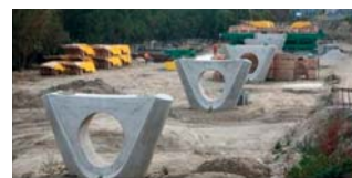
Starý most: Pozemky dali J&T vraj omylom, obratisko stavajú zbytočne V projekte električky časť most je viacero nezapracovaná. Petrážanský breh okolo mosta chci rekonštruovať Kmitník, J&T aj HB Reavis. BRATISLAVA SME SA