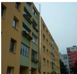
Odpojenie sa od dodávateľa tepla a úspora v cene sa podarila aj na Haanovej 37.

Novela zákona o tepelnej energetike prijatá v roku 2014 obmedzila Vaše práva ako vlastníka bytu v bytovom dome tak, že bez súhlasu Vášho terajšieho dodávateľa tepla je nemožné zmeniť tohto dodávateľa napríklad vtedy, ak si svoje veci v bytovom dome spravujete sami a radi by ste si zriadili vlastnú kotolňu.