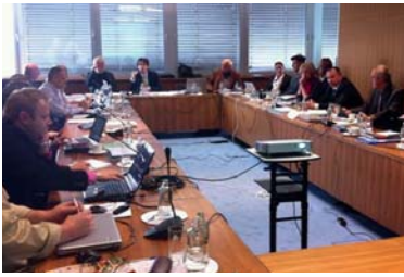
Diskusia s verejnosťou je pri vytváraní pravidiel dôležitá.

Tvorit' pravidlá znamená aj chrániť práva ľudí pred tými, ktorí ich nerešpektujú (napr. čierne stavby).