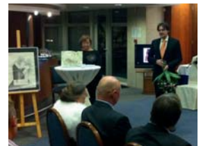
Prvá kuchárska kniha pre nevidiacich na Slovensku vyšla aj s mojou podporou.

V súčasnosti je každý 10-ty Petržalčan osobou vo veku nad 65 rokov a tento počet bude narastať. Obec ani mesto v tomto smere nemôžu zostať pasívni a musia podporovať seniorov rôznymi spôsobmi, osobitne aj tým, že vytvoria možnosti, aby mali (finančne) zvýhodnený prístup ku kultúrnym, športovým (fitness) a zdravotníckym zariadeniam, a to formou zliav zo vstupného alebo príspevku na dopravu. Je potrebné podporovať zariadenia, akými sú napr. Dom tretieho veku v Petržalke a denné stacionáre pre seniorov. Budovanie, rekonštrukcia a modernizácia takýchto zariadení sociálnych služieb je možná aj z finančných prostriedkov EÚ na roky 2014 až 2020, rovnako ako aj podpora zariadení sociálnej kurately (detské domovy) a podpora výkonu odborných činností v tejto oblasti (napr. psychológia a sociálna práca). Našu podporu a pomoc si okrem seniorov a sociálne odkázaných ľudí vyžadujú aj ľudia zo zdravotným postihnutím (napr. budovaním bezbariérových prístupov a podporou aktivít, ktoré im zlepšia kvalitu života).