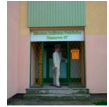
Knižnice by si tiež zaslúžili modernizáciu.