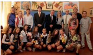
Nielen deti v zahraničí si zaslúžia moderné školy, škôlky a knižnice.

Len na území Petržalky je viac ako 700 mamičiek, ktorých deti neboli prijaté z kapacitných dôvodov do materskej školy a takmer 400 detí nemá možnosť byť umiestnených do jasli. Podobne je na tom celá Bratislava, len celkové počty sú vyššie. Tento problém je čiastočne spôsobený zlou legislatívou