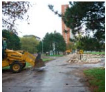
Verme, že námestia sa nebudú obnovovať vždy až pred voľbami.