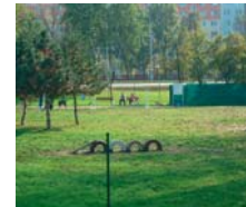
Prvý uzavretý výbeh pre psov v Petržalke, snáď nie aj posledný.

Hoci až tesne pred voľbami, revitalizácia Námestia hraničiarov v Petržalke alebo konečne prvý uzavretý výbeh pre psov na území Petržalky sú kroky správnym smerom. Zaslúžia si to nielen