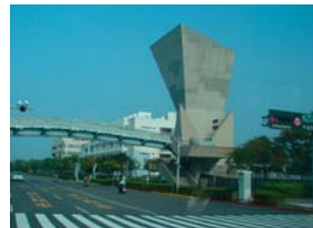
Pri budovaní vedecko-technologických parkov máme vzory v zahraničí (Taiwan).

Je všeobecne známe, že dôsledkom hazardu je nárast na hazarde závislých a sociálne odkázaných ľudí, ktorí predstavujú bremeno pre vlastnú rodinu a celú komunitu, či obec. Ideálnym by bol úplný zákaz hazardu, prijateľným riešením, ktoré poznáme v zahraničí (napr. v Rakúsku je len pár veľkých štátom povolených herní, kde majú zakázaný prístup sociálne odkázaní ľudia). To, čo Petržalka i Bratislava skutočne potrebujú, nie je hazard, ale podpora zdravého podnikateľského prostredia, kultúrno-kreatívneho priemyslu (dizajnéri, IT, biotechnológie a biomedicína a nové materiály – nanotechnológie), vytváranie priaznivých podmienok pre investorov a podpora vzdelávania k získaniu citu pre podporu lokálnych produktov.